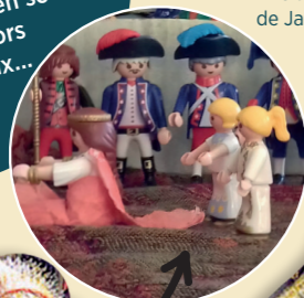
Le sacre de Napoléon, de Jacques-Louis David réinterprété avec des Playmobil®