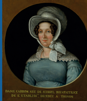
DAME CARRON NÉE DE SEISSEL, BIEN-AÏTRICE DE L'ETABLISSE, DÉCÉDÉE À THONON

Plus de 130 objets racontent cette fresque historique. Ils illustrent la richesse et la diversité des collections du musée.