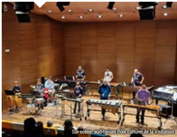
Sur scène, auditorium Pôle culturel de la Visitation