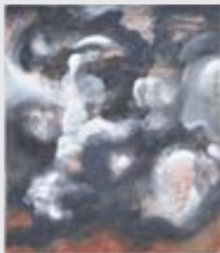
Vanessa Fanuele, Tempesta 02, 2023, huile sur toile, 80 x 70 cm