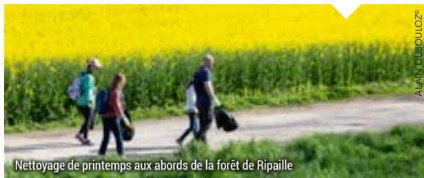
Nettoyage de printemps aux abords de la forêt de Ripaille

• Rendez-vous à 9h au port de Rives (Place du 16 Août 1944) • Inscription : 04 50 17 08 28