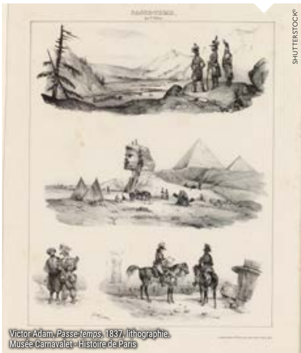
Victor Adam, Passe-temps , 1837, lithographie. Musée Carnavalet - Histoire de Paris