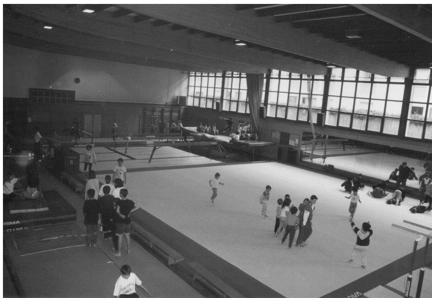
1 Fi 3001 – Salle de l'Etoile sportive (1995)