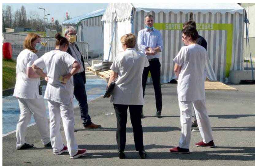
POSTE MÉDICAL AVANCÉ DEVANT LE SERVICE DES URGENCES POUR LE TRI DES PATIENTS

Les acteurs locaux (institutionnels, sociaux et économiques) ont été nombreux à se mobiliser derrière les Hôpitaux du Léman et à soutenir le personnel soignant. « On évalue les dons, numéraires ou en nature, à hauteur de 137 000 € », souligne le directeur. Des repas, gâteaux, confiseries, mais aussi des kits cosmétiques... Les dons ont été variés et très nombreux, sans oublier les masques et le matériel divers financés par les entreprises du Chablais. « Un soutien essentiel pour les équipes à des moments où la situation était compliquée et difficile. »