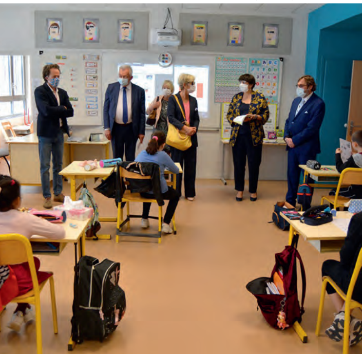
Aurélien Mocq ©