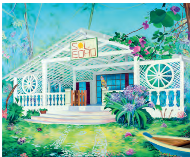
Marion Charlet, Soledad , 2015, acrylique sur toile, 230 x 180 cm, © ADAGP Paris, 2020 / courtesy de l'artiste