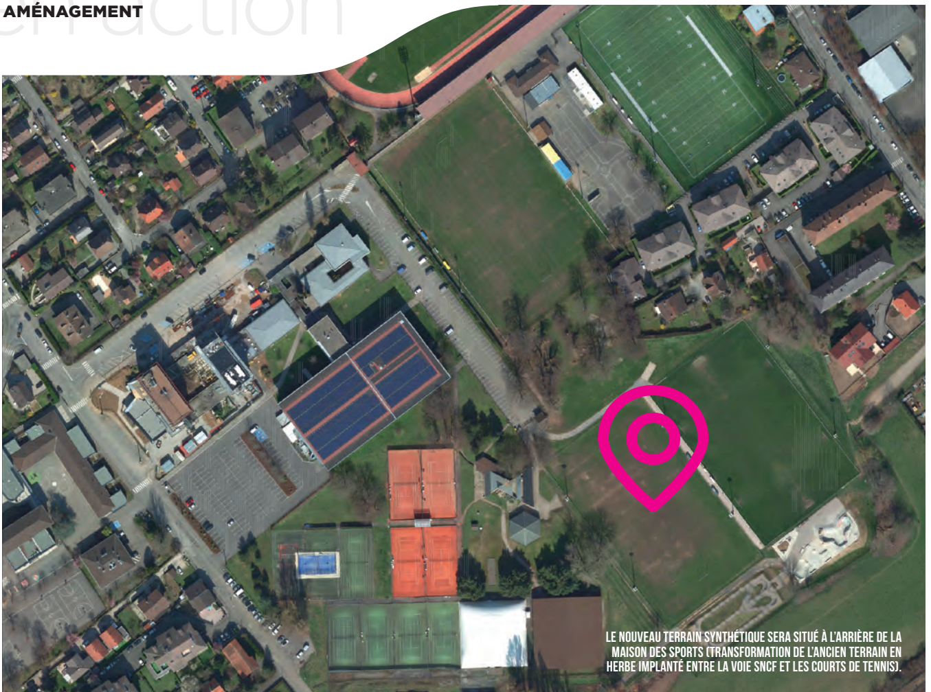
LE NOUVEAU TERRAIN SYNTHÉTIQUE SERA SITUÉ À L'ARRIÈRE DE LA MAISON DES SPORTS (TRANSFORMATION DE L'ANCIEN TERRAIN EN HERBE IMPLANTÉ ENTRE LA VOIE SNCF ET LES COURTS DE TENNIS).