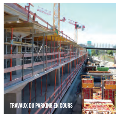
TRAVAUX DU PARKING EN COURS

Ces bateaux nouvelle génération, équipés d'une technologie hybride parallèle et munis de coques perfectionnées, permettront de réduire la consommation de carburant de plus de 40 %. Ils seront également équipés, sur le toit, de panneaux solaires pour un apport électrique d'appoint. Ainsi, le trajet en bateau d'une personne générera 30 fois moins de rejets de CO 2 que si elle faisait le même déplacement en voiture individuelle.