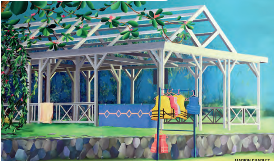
MARION CHARLET I WILL REST THERE 2017 ACRYLIQUE SUR TOILE 110 X 160 CM